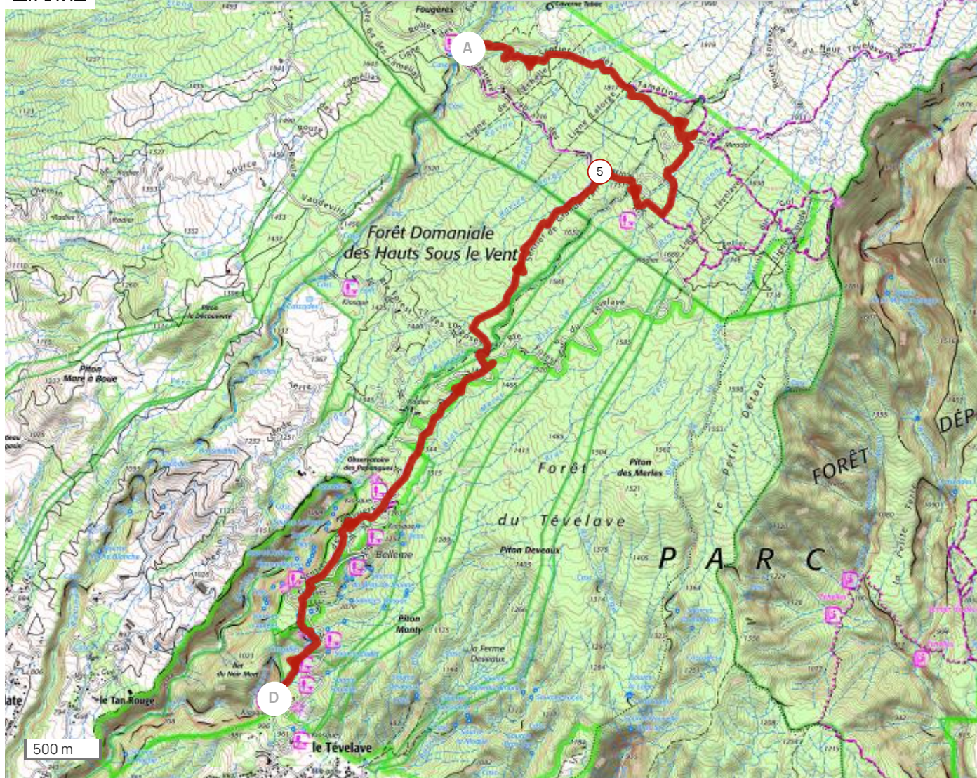
Leaflet | Maps © Thunderforest - Data © OpenStreetMap contributors, © IGN France ign.fr